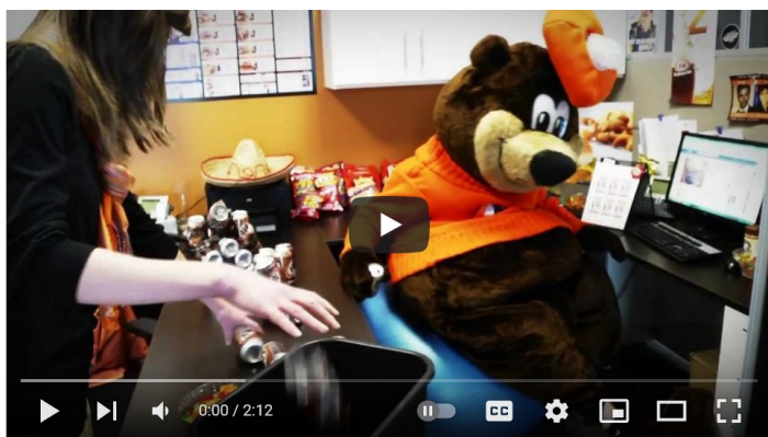
The Bear is Back! Episode 4: Back in the Office