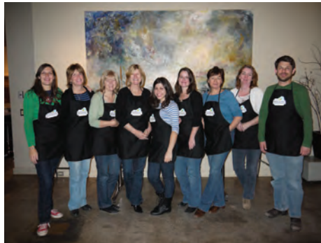
L'équipe d'HabiloMédias à la séance réflexion de 2012