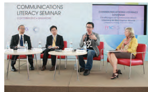
Communications Literacy Seminar à Singapour.

HabiloMédias est une ressource exceptionnelle pour apprendre l'importance de la littératie numérique, tant aux enseignants en exercice qu'à ceux en formation.» - Professeur associé, Faculté de l'éducation, Alberta