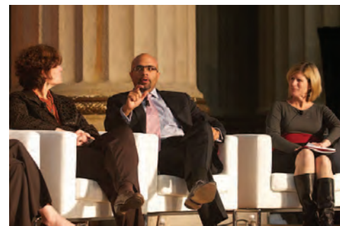
Conférence de FOSI à Washington, D.C.

Un des points saillants de 2012 fut que Son Excellence, le très honorable David Johnston, gouverneur général du Canada, soit devenu président d'honneur de notre organisation récemment renommée. Notre vision s'harmonise parfaitement avec deux piliers du mandat de Son Excellence : soutenir les familles et les enfants et accroître l'apprentissage et l'innovation.