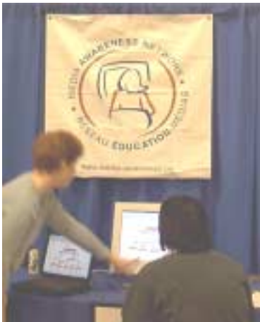
"Spin the Web" day at Oakville Public Library.

I'm extremely impressed with this site. As part of my Resource-Based Learning course for education students, I will definitely make them aware of this site. It's tremendous!